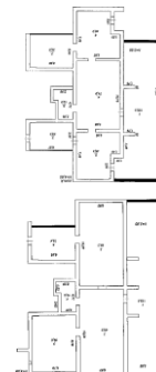
НП-1 365 м²