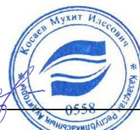
Қосаев М. И. Қазақстан Республикасының сертификатталған аудитору 2003 жылдың 24 желтоқсанында берілген №558 аудитордың біліктілік куәлігі